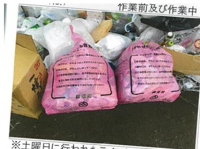
※土曜日に行われたイベント