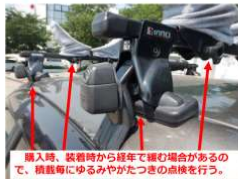
購入時、装着時から経年で緩む場合があるので、積載毎にゆるみやがたつきの点検を行う。