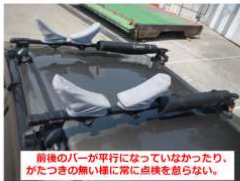
前後のバーが平行になっていなかったり、がたつきの無い様に常に点検を怠らない。