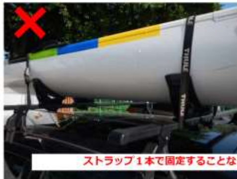
ストラップ1本で固定することなく、前後1本ずつ使用し固定すること。

クラフト類を車面上部に積載し、搬送する際の好ましくない状況を紹介します。 高速走行時に積載物を落下させ、後続車に当たるなどした場合、 人命にかかわる大事故につながるだけでなく、事故を起こした本人の人生も大きく変わってしまう可能性があります。 今一度、積載状況を再確認し、事故防止に努めてください。