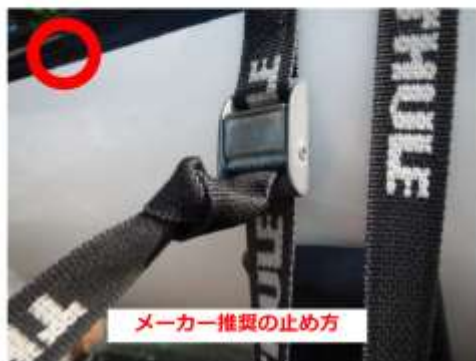
メーカー推奨の止め方