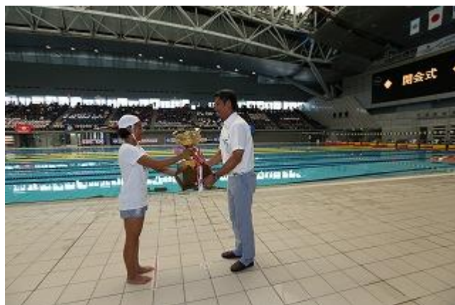
＜理事長杯返還・レプリカ贈呈＞ 昨年度総合優勝 西浜SLSC