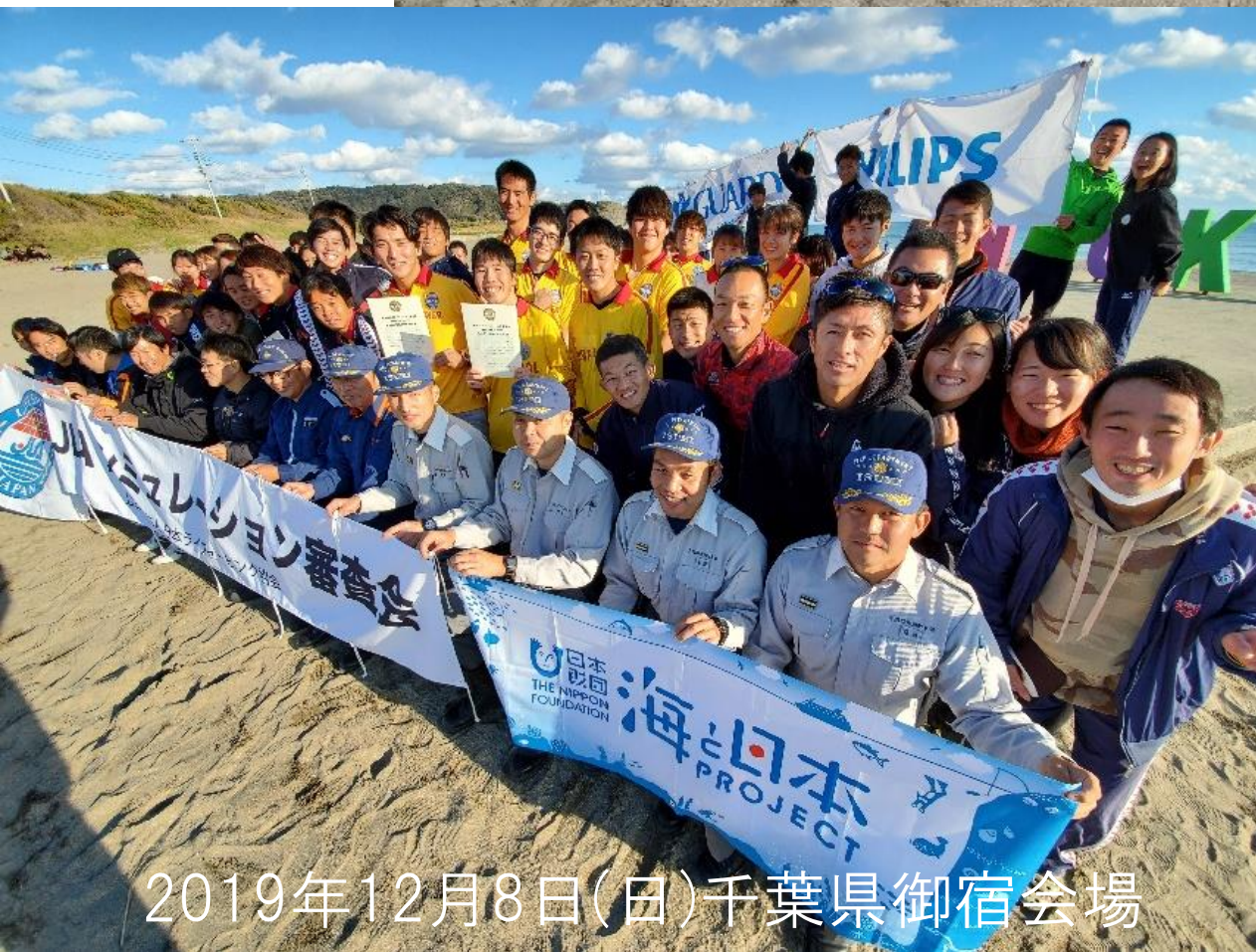
2019年12月8日(日)千葉県御宿会場