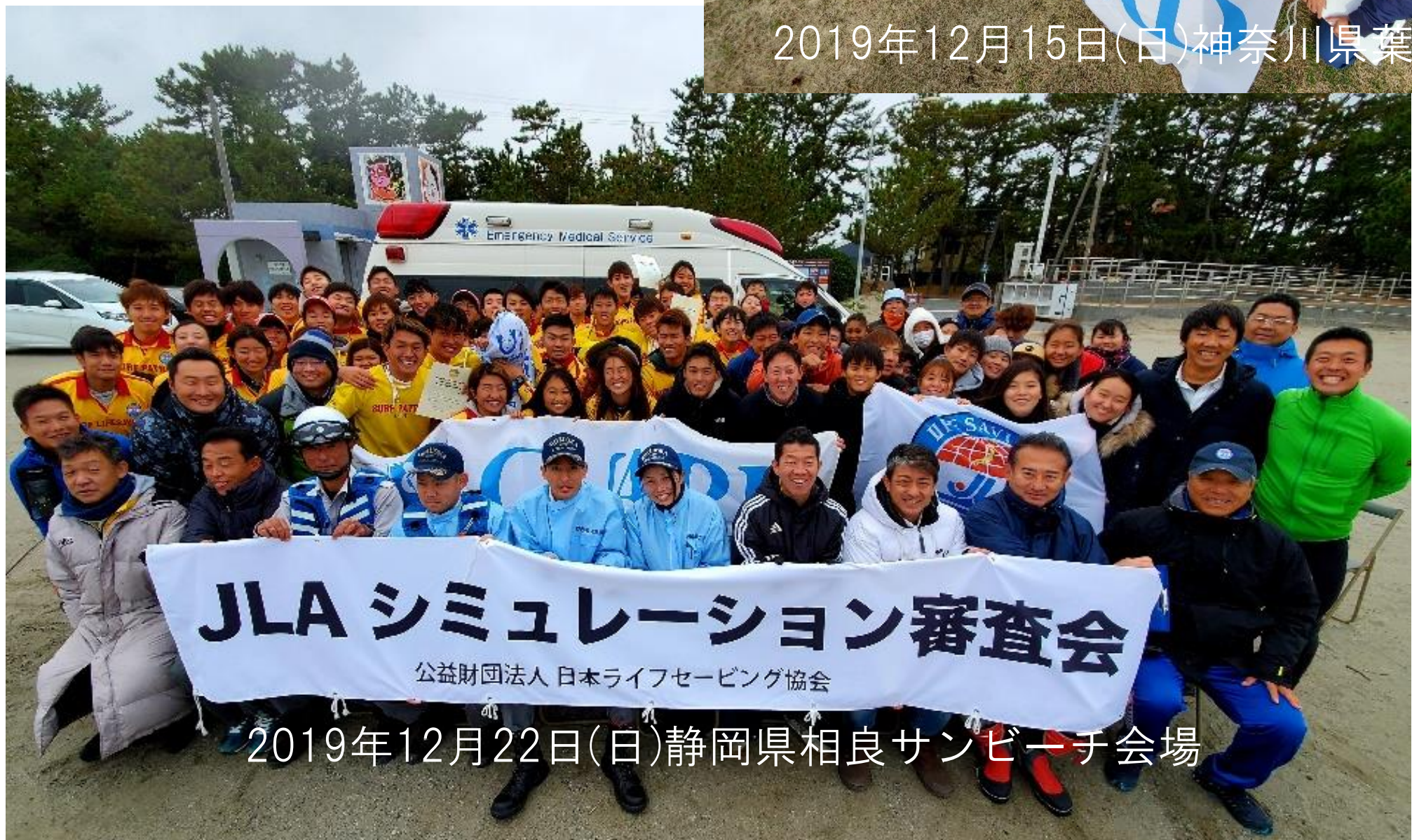
2019年12月22日(日)静岡県相良サンビーチ会場