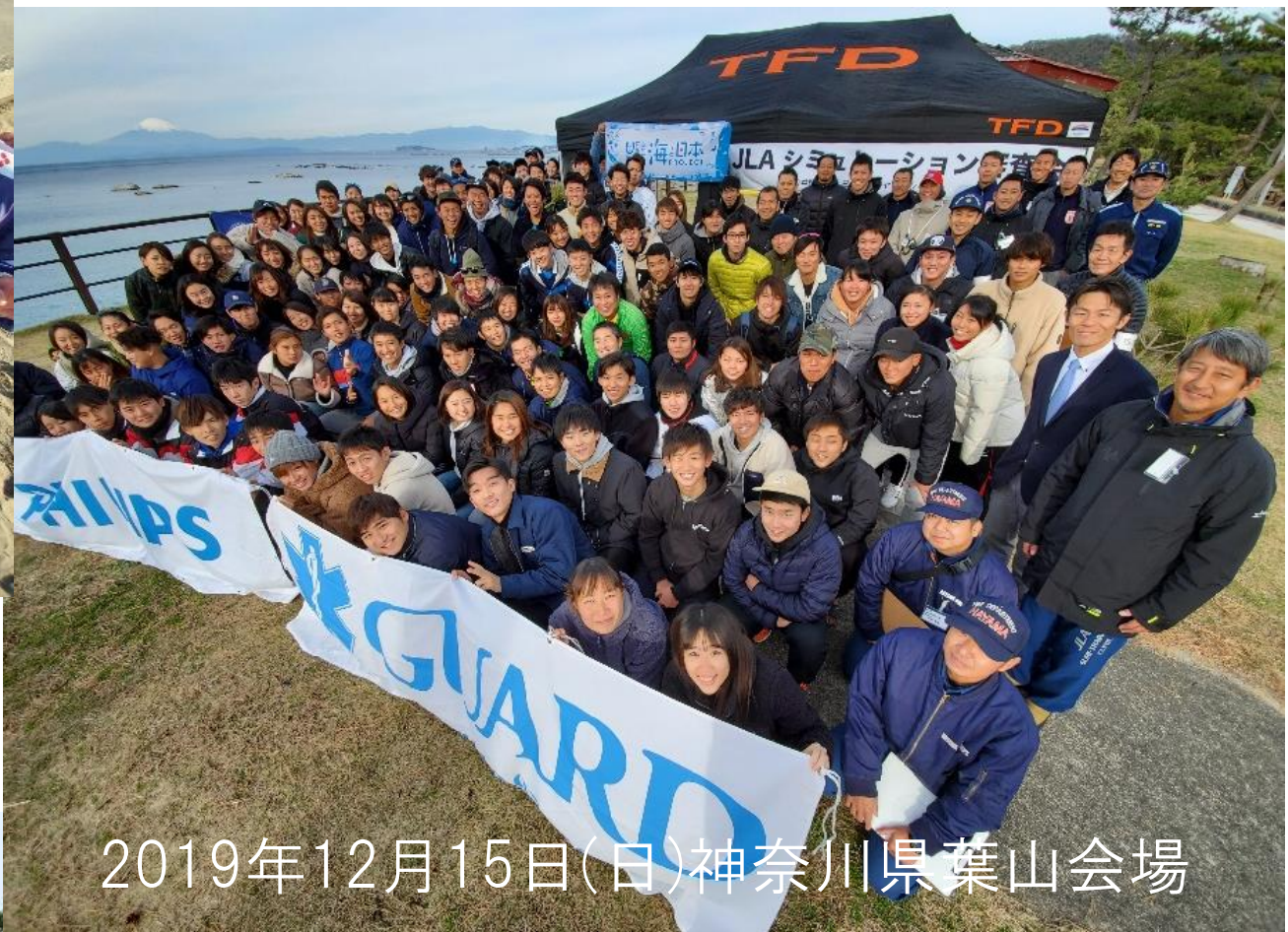
2019年12月15日(日)神奈川県葉山会場