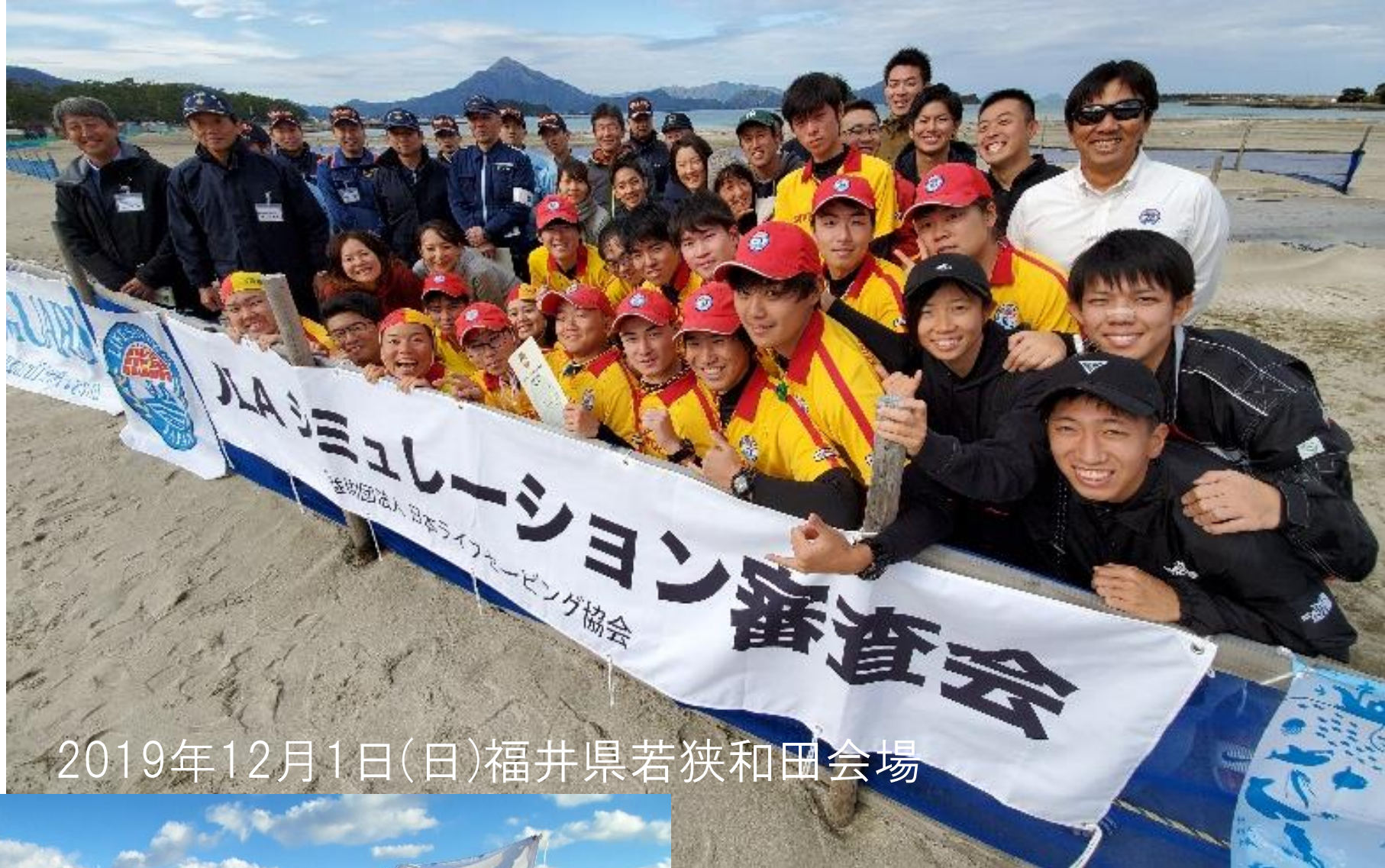
2019年12月1日(日)福井県若狭和田会場