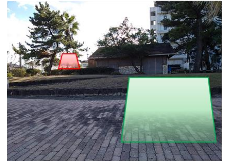
赤色→次番待機テント 緑色→エキストラ待機テント (想定外)