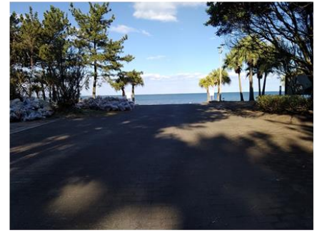
緊急車両進入路(海向き)