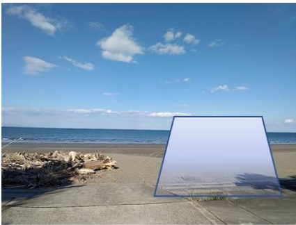
L S 詰所テント