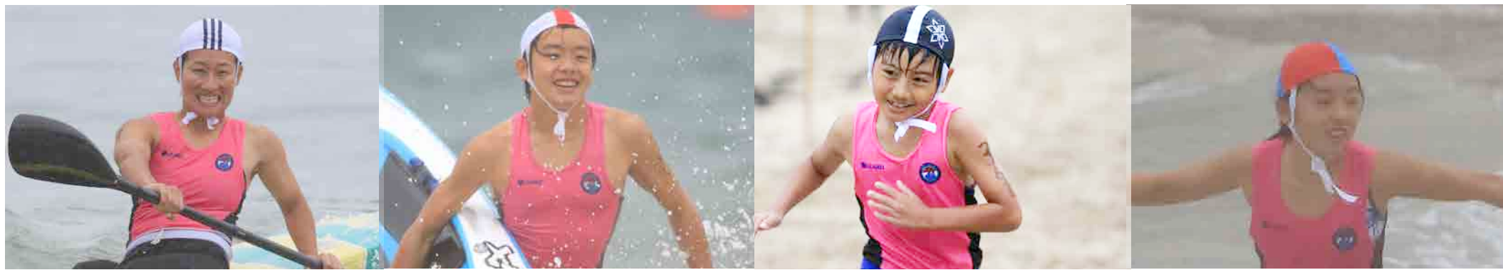
男子 242 名、女子 218 名 合計 460 名 (小学生 177 名、中学生 74 名、高校生 120 名、マスターズ 89 名)